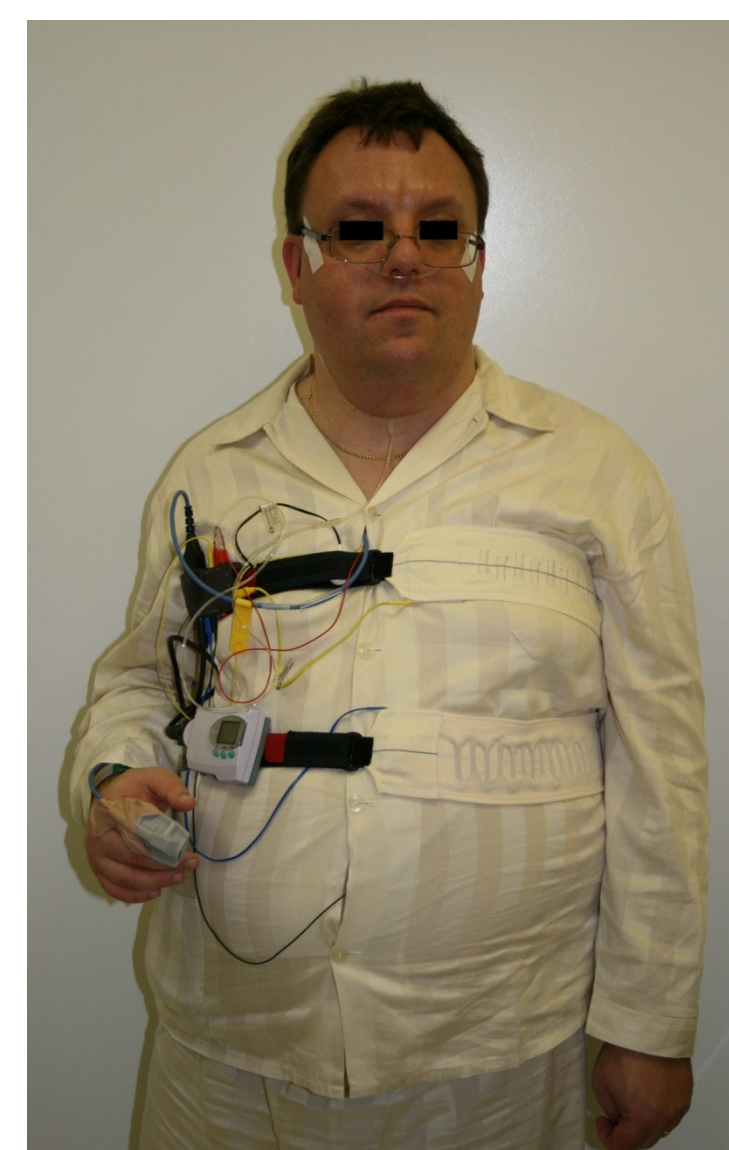
Obr. 1 Pacient připravený k vyšetření limitovanou polygrafií

Všichni pacienti s podezřením na poruchu ventilace ve spánku absolvovali ORL vyšetření. V případě nejasného nebo nejednoznačného nálezu bylo provedeno společné konzultační vyšetření neurologem, ORL lékařem a stomatologem za přítomnosti pacienta.